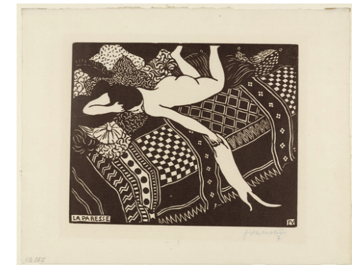
Vallotton, Felix (1865-1925): La pigrizia (La paresse), 1896. New Digitale (1) York, Museum of Modern Art (MoMA). Woodcut, composition: 7 x 8 13/16" (17.8 x 22.4 cm); sheet: 9 3/4 x 12 3/4" (24.7 x 32.4 cm). Larry Aldrich Fund. Acc. n.: 193.1954.